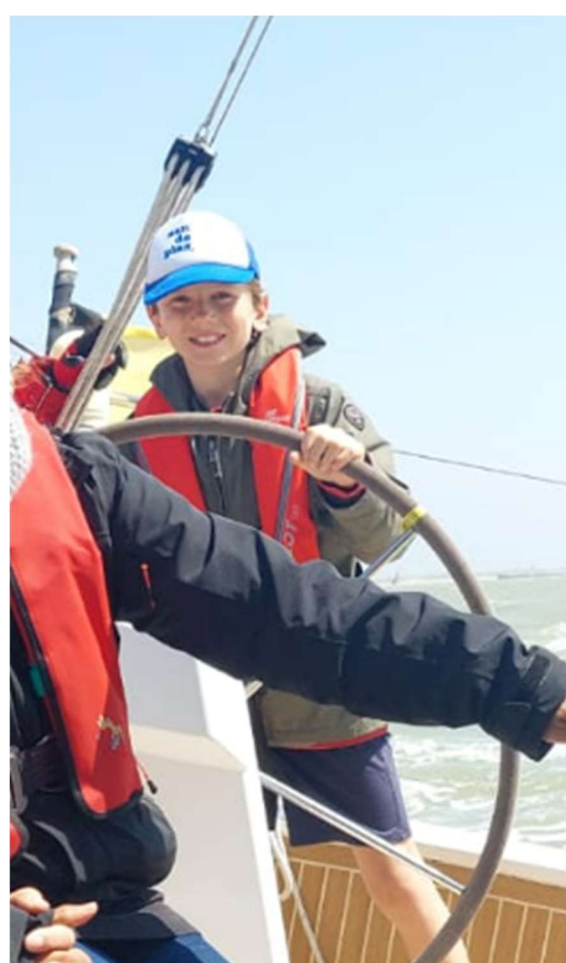
Enkele sfeerbeelden op zee