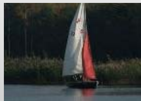
Napadelis na de "deep maintenance"

Om onze waardering te betuigen voor dit zeer geslaagde project, engageert ZachteKracht zich in 2010 tot het opleiden van de opvoeders als zeiler zodat ze autonoom kunnen werken zonder telkens een zeiler van ZachteKracht te moeten inschakelen.