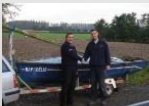
Napadelis voor de "deep maintenance"